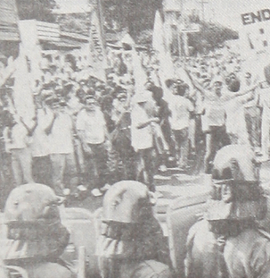
So rezultati panamskih volitev res ponarejeni?

PANAMA CITY, 9. maja – Politika napetost v Panami je danes dosegla vrhunec: ZDA so pozvale privržence opozicije, naj grejo na ulice braniti zakonito izvoljenega predsednika Gullera Endarove. Endarova je kandidata transnacionalne koalicije demokracije. Ameriška opozicijska delegacija trdi, da je pri volitvah prišlo do nepravilnosti in bi jo zmagoval Carlos Duque, kar je bilo neuradno že objavljeno. Endarove vemo privržence: je moral na mestnih ulicah ustaviti policija.