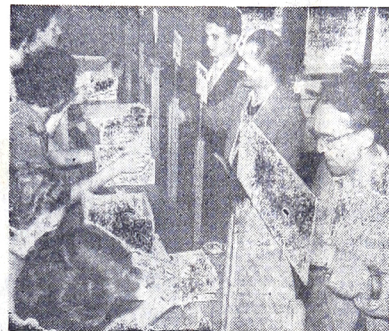
Prvi delegati v kongresni informacijski pisarni

Jutri se bo začel kongres. In zadnje dni je že čutili praznično kongresno vzdušje, ki mu dajejo slavnostno obeležje naša okrašena mesta, Vseposvoda, tudi v najoddaljenejših vaseh.