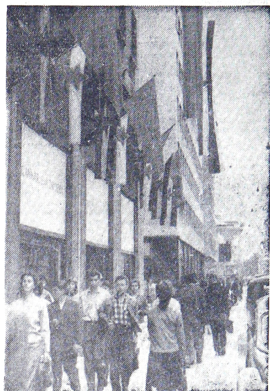
Zastave v pozdrav kongresu

Vsem delegatom in gostom IV kongresa naš velja naš plamen pozdrav z iskrenimi željami za plodno in uspešno delo na kongresu in za prijetno počutje v teh dneh, ki jih bodo tu preživeli. Dobrodošli v Ljubljani!