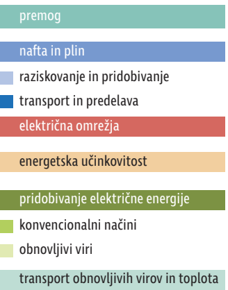
STRUKTURA INVESTICIJ V ENERGIJO V SVETU leta 2015, v odstotkih