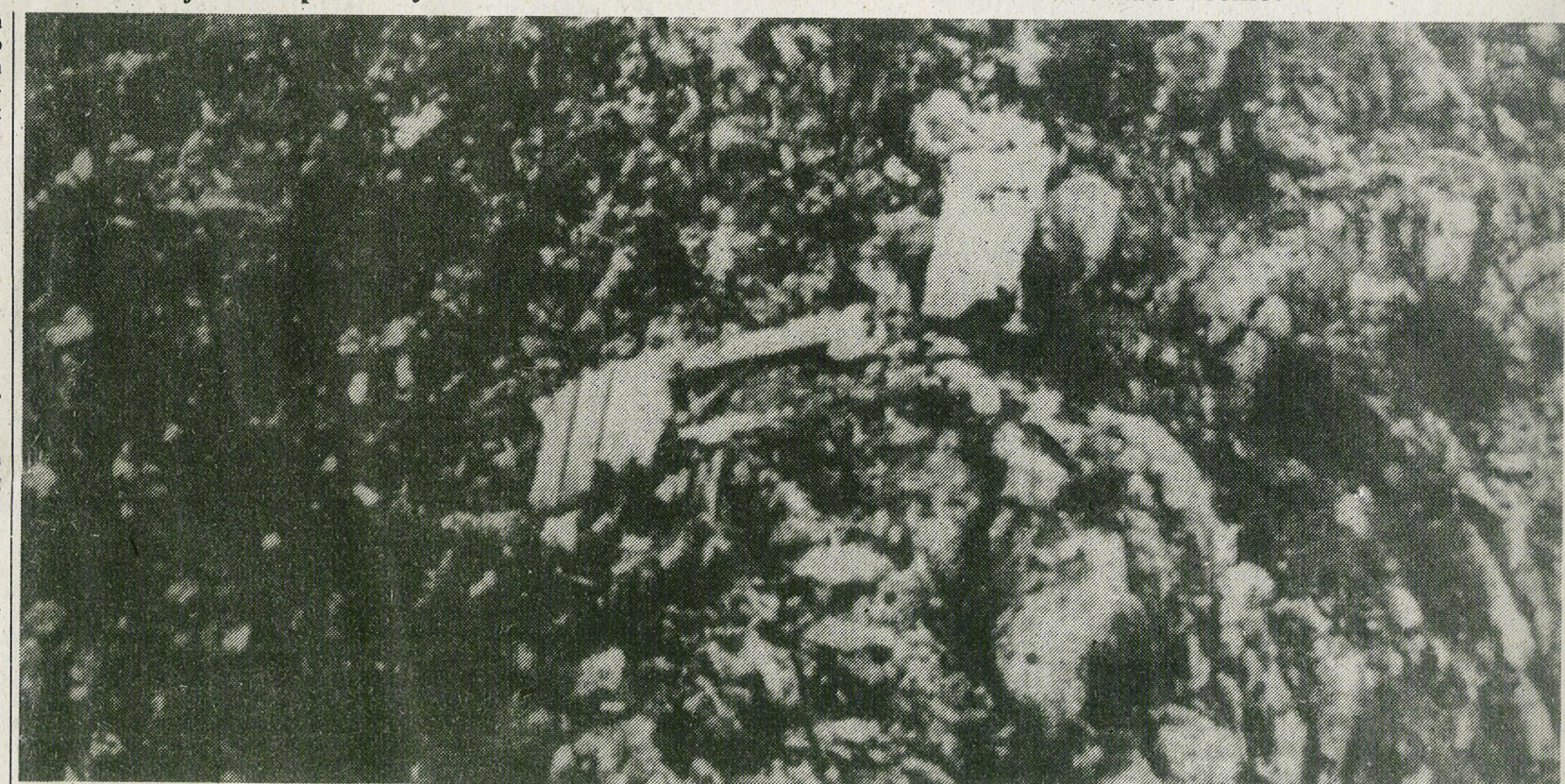
NA GORI SAN PIETRO – Od mogočnega DC-9 so ostali samo raztreseni drobiči.

Reševalne ekipe, ki so jih pripeljali na kraj nesreče helikopteri, so naglo ugotovile, da ni preživelih. Trupla ponesrečenec so bila razmetana na območju 300 do 400 metrov, pomešana z razbitinami letala. V vasi ob vznožju San Pietro, Saint-Jean de Petretto Bichichano so uredili zaslon mrliške večice, »poročala AFP. Tanjug pa poroča, da je nočjo odletela iz Beograda štirčlanska komisija zveze valde, ki bo sodelovala kot opazovalka pri preiskavi.