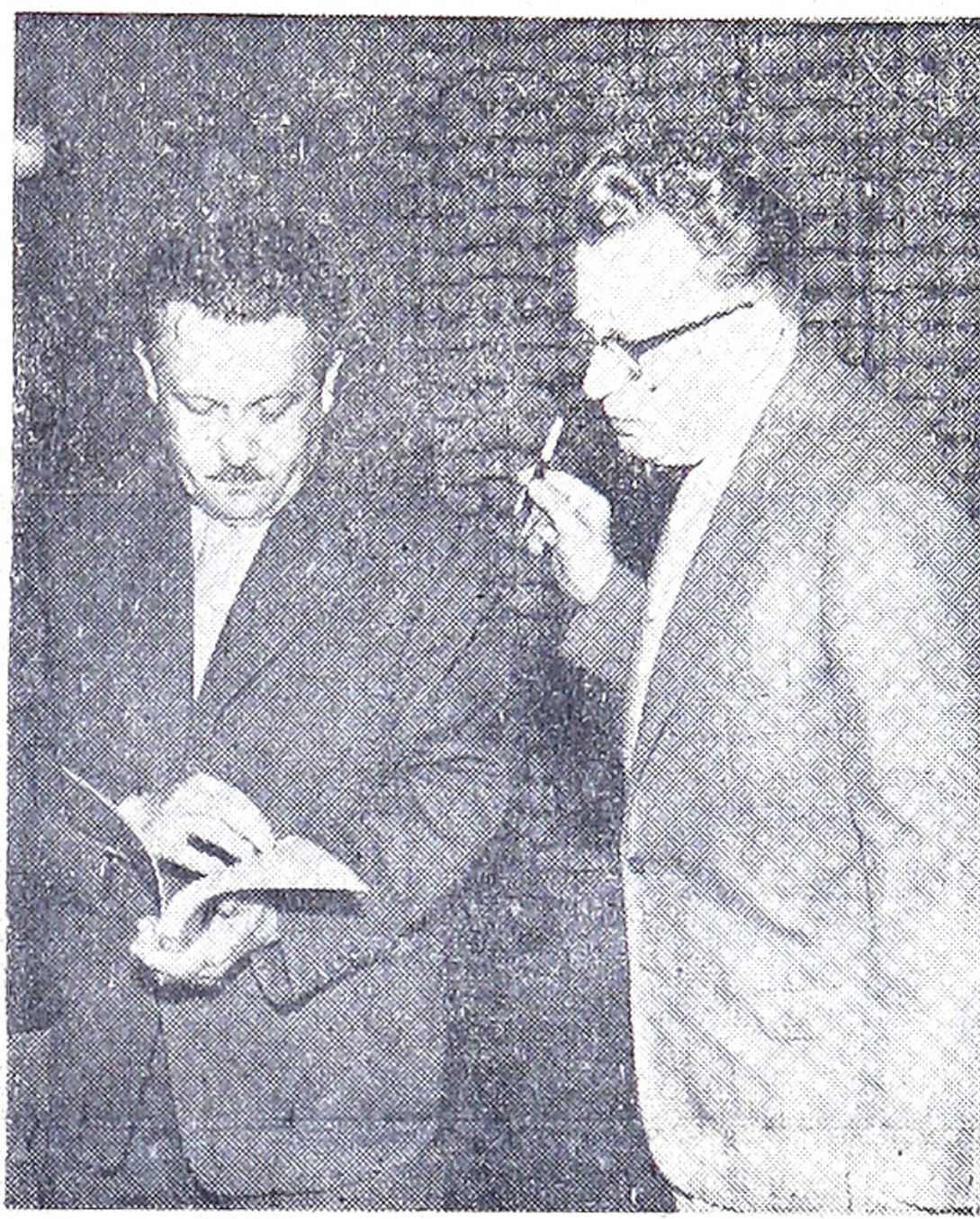
Tovariša Edvard Kardelj in Miha Marinko